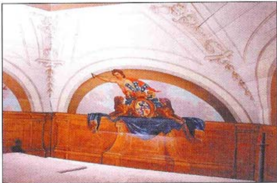
De balustrade met het familiewapen van één van de drie opdrachtgevers van de schildering. Heraldisch gezien zijn de leeuwen ernstig gedegeneerd