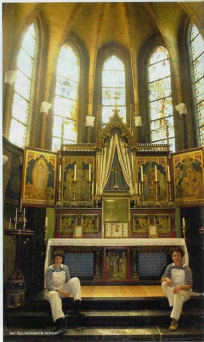
Het Duo Veldman & Veldman

Tijdens de recente restauratie van de Sint Willibrorduskerk in Kloosterburen (Gr.) zijn vier historische muurschilderingen ontdekt in de zeven muurnissen van het priesterkoor. Bij toeval kwamen de gesjabloneerde afbeeldingen tevoorschijn, nadat bouwvakkers asbestplaten verwijderden. Het herstel van twee in zeer slechte staat verkerende muurschilderingen werd meteen in het kerkrestauratieplan opgenomen. De tegenoverliggende identieke twee schilderijen moesten als verloren worden beschouwd. Wel werd besloten dat deze opnieuw in kopie zouden worden aangebracht. Decoratie- en restauratieschildersbedrijf Veldman & Veldman uit Niezijl mocht deze bijzondere opdracht uitvoeren.