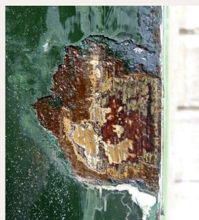
Kopse kant voordeur

Op de kopse kant van de voordeur werd, in tegenstelling tot het deurfront, een compleet lijkend verfpakket aangetroffen. De oudst aanwezige kleur was een roodbruin (foto links).