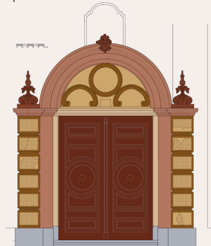
Kleurvoorstel stucwerkpoort – tekening van M. van Voorn, Bureau voor bouwhistorie BDM