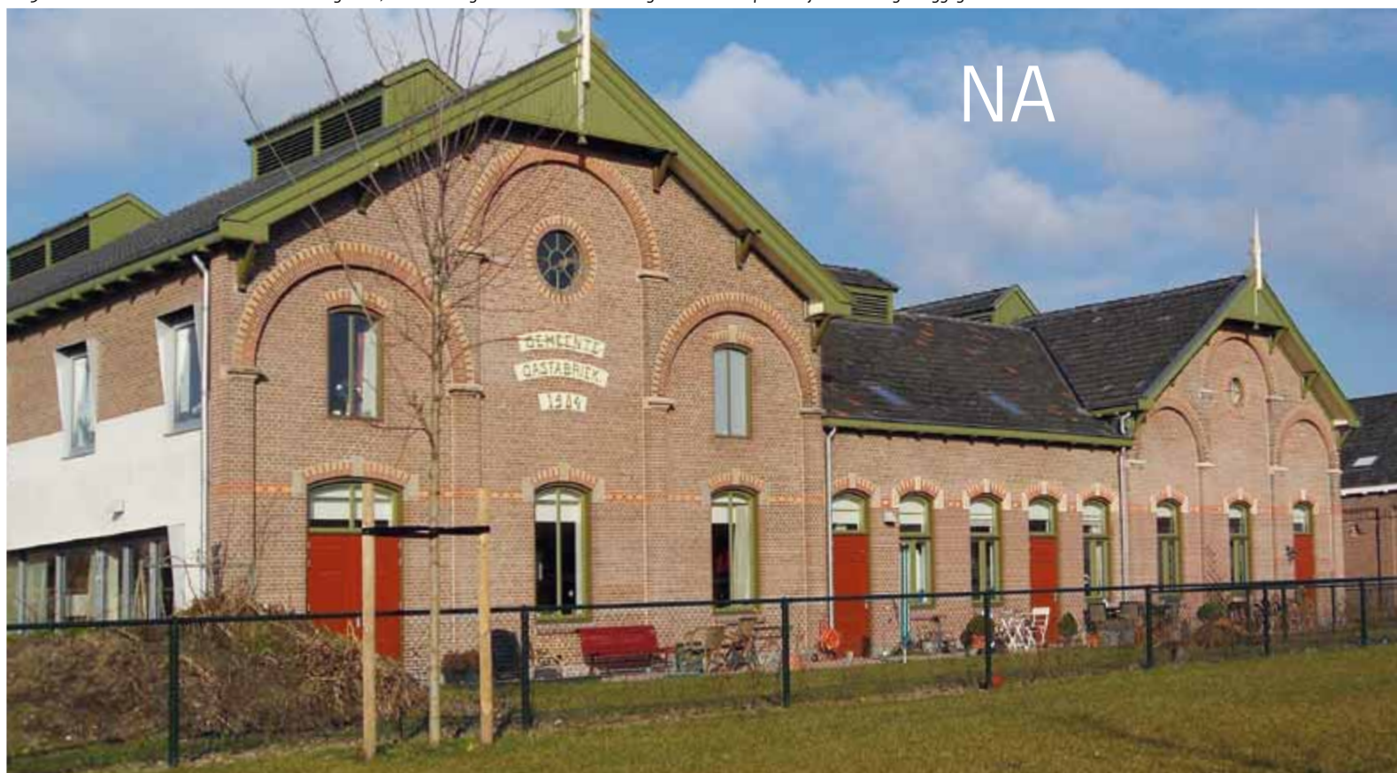
2013: het herstelde schone siermetselwerk en het groene, rode en lichtgele houtwerk hebben het gebouw de oorspronkelijke uitstraling teruggegeven